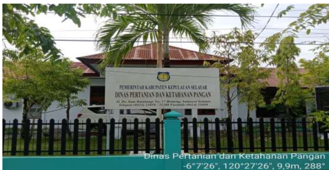
Gambar 1 Foto Kantor Dinas Pertanian dan Ketahanan Pangan Kabupaten Kepulauan Selayar

Dinas Pertanian dan Ketahanan Pangan dibentuk berdasarkan Peraturan Daerah Kabupaten Kepulauan Selayar Nomor 4 Tahun 2020 Tentang Pembentukan dan Susunan Perangkat Daerah (Lembaran Daerah Kabupaten Kepulauan Selayar Tahun 2020 Nomor 98, Tambahan Lembaran Daerah Kabupaten Kepulauan Selayar Nomor 47). Dinas Pertanian dan Ketahanan Pangan, adalah tipe A yang melaksanakan urusan pemerintahan bidang pertanian dan urusan pemerintahan bidang pangan. Dinas Pertanian dan Ketahanan Pangan beralamat di Jl. DR. Sam Ratulangi No. 17 Benteng, Kode Pos 92812. E-mail programdistankp@gmail.com .